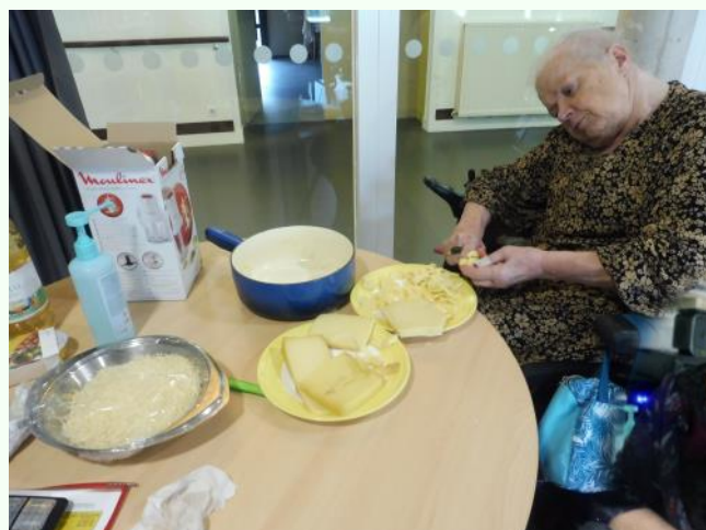
Découverte pour certains de la gastronomie Savoyarde et partage des savoirs Bretons!!