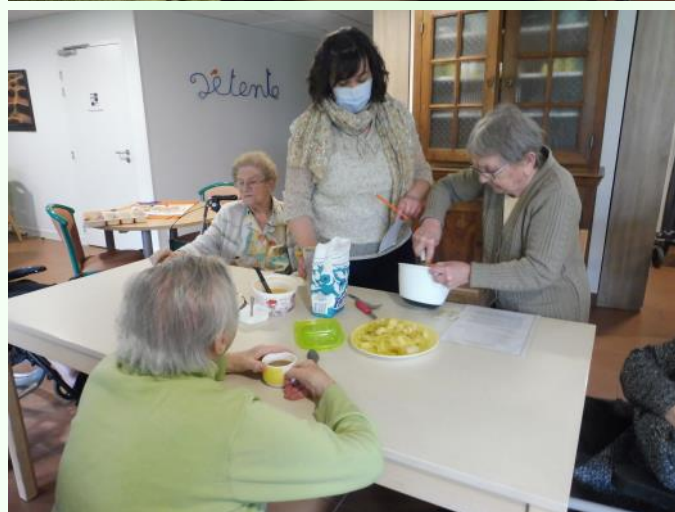
Préparation de beignets pour fêter Carnaval, en toute convivialité