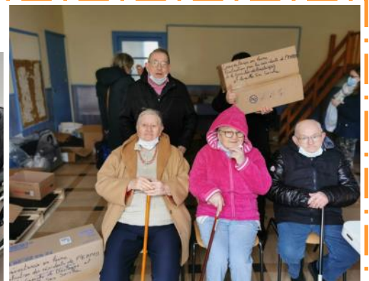
Des couvertures tricotées par les résidents ont été remises à la population d'Ukraine