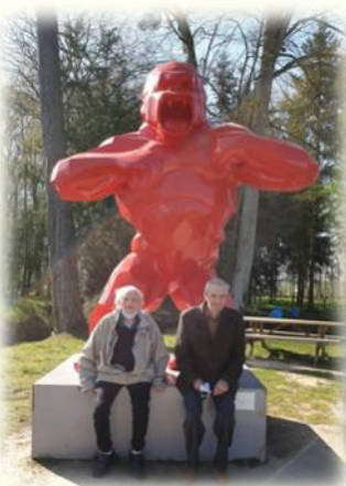
Sortie au château des pères à Piré sur seiche.