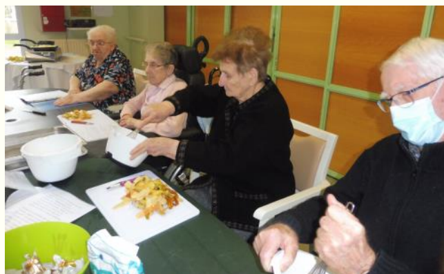
Préparation et dégustation selon la tradition!