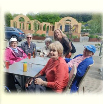
Et à La Gacilly