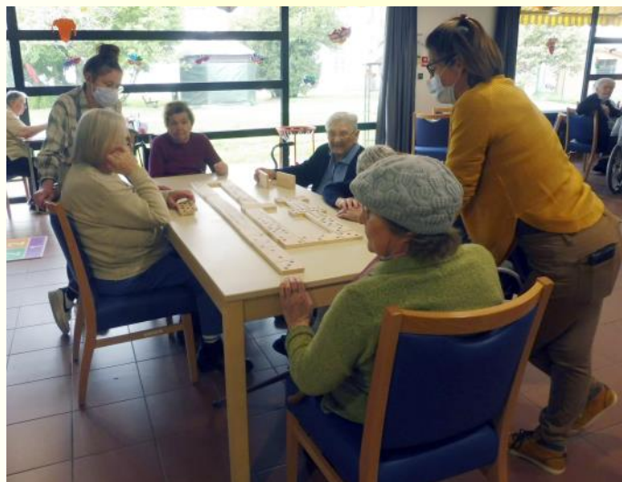
Jeux d'adresse, un bon moment partagé