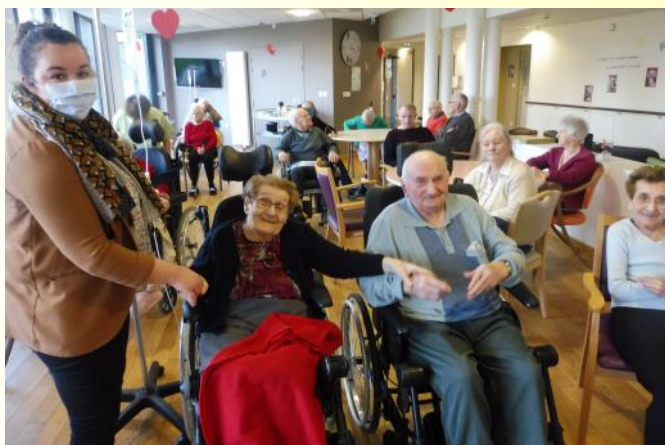
Fête des anniversaires, danse, musique et sourires au rendez vous!!