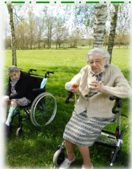
Retour des beaux jours!! Loto en plein air et balade dans le parc