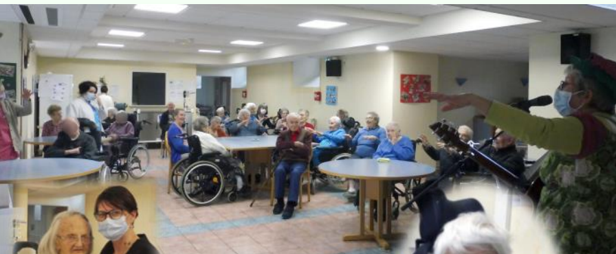
Les anniversaires en musique.