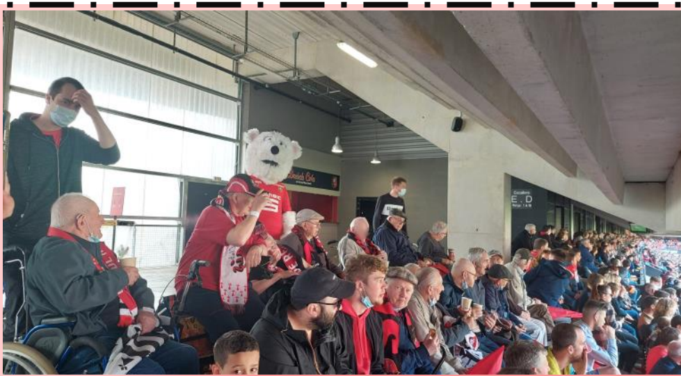
Photos souvenir avec Erminig la mascotte des Rennais