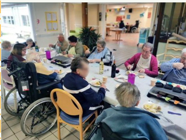
Repas conviviaux autour d'une raclette et de galettes bretonnes