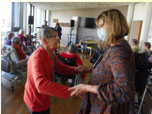
Anniversaires du mois en chansons.