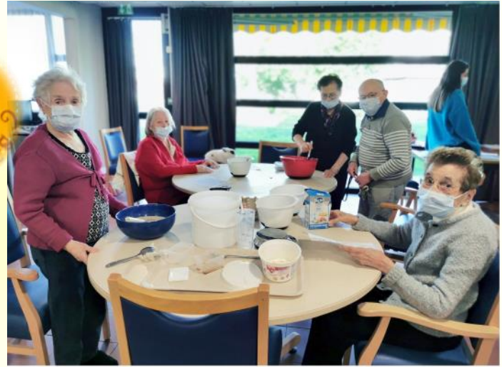
Préparation de la pâte à crêpes pour la Chandeleur.