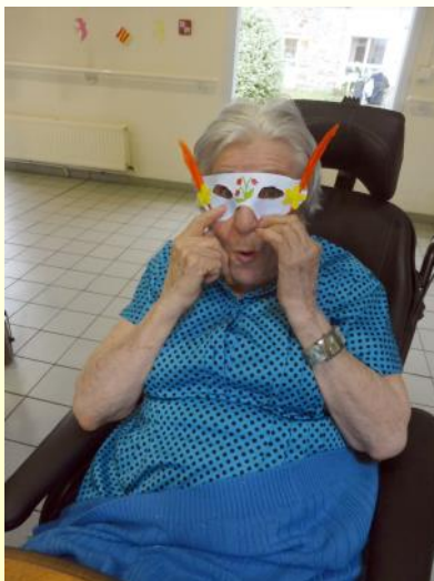
Bons petits moments passés autour du carnaval