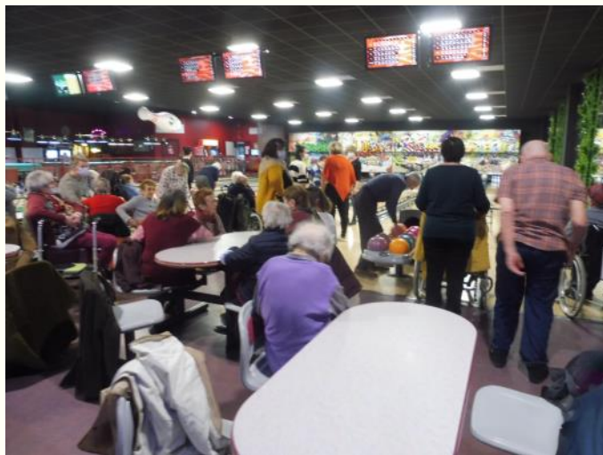
Retour au bowling à Vitré