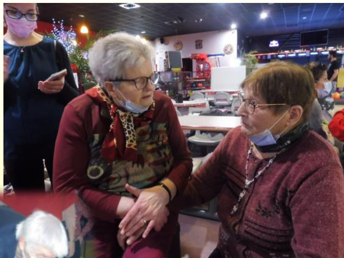
Retrouvailles entre résidents