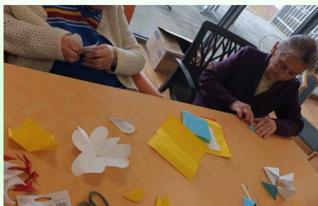
Activités du quotidien!!