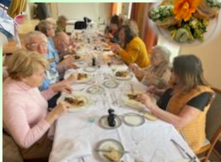
Déjeuner au restaurant du lycée hôtelier de La Guerche