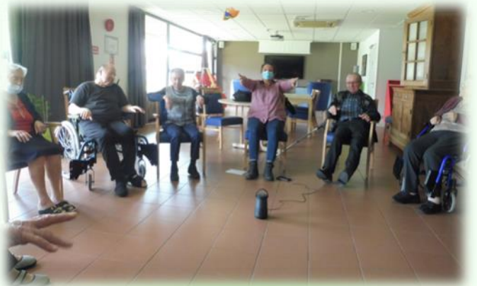
Sophrologie, un bon petit moment de relaxation, fort apprécié