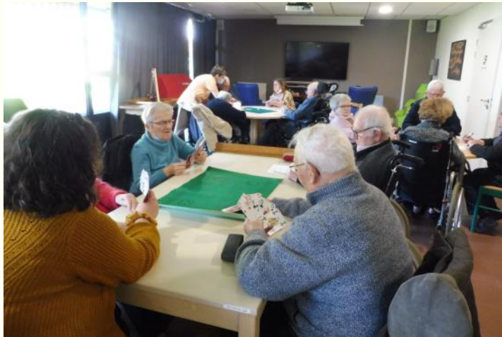
Cartes en mains, tous à la belotte