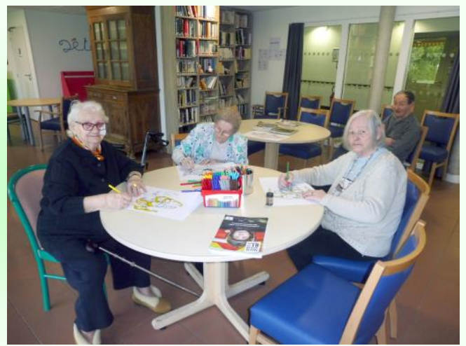
Les activités du quotidien.